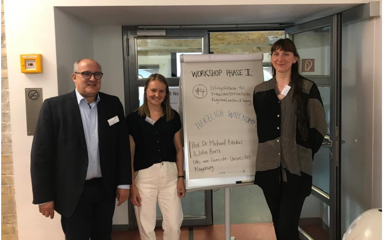
« Zurück Team der OVGU (Bild 3 von 4) » Vorwärts