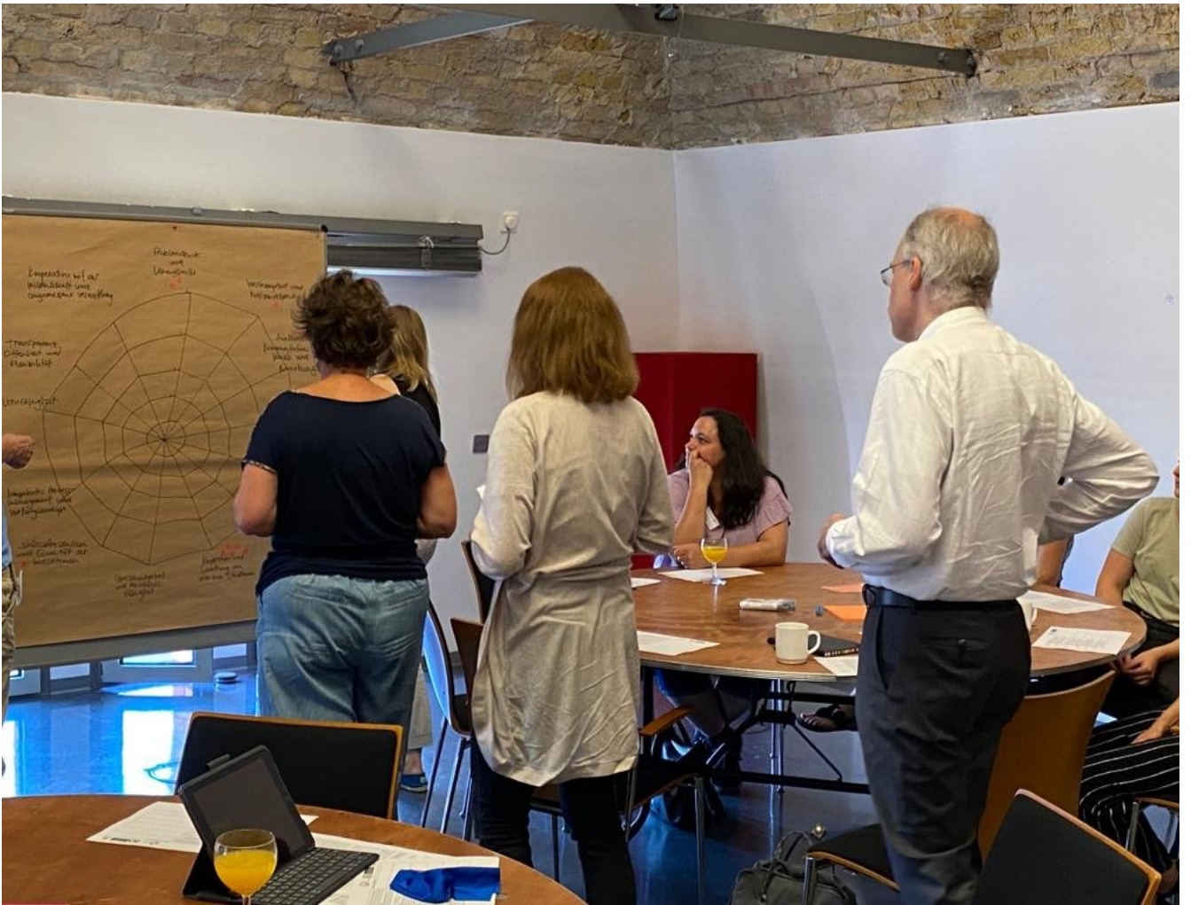
« Zurück Workshop Teilnehmer*innen (Bild 4 von 4)